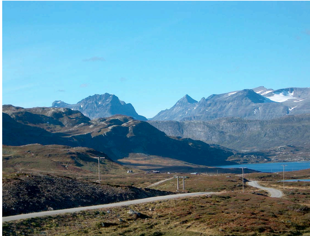
Mot Torfinnstindane, Store Knutsholstind og Kalvehøgda frå Slettefjell